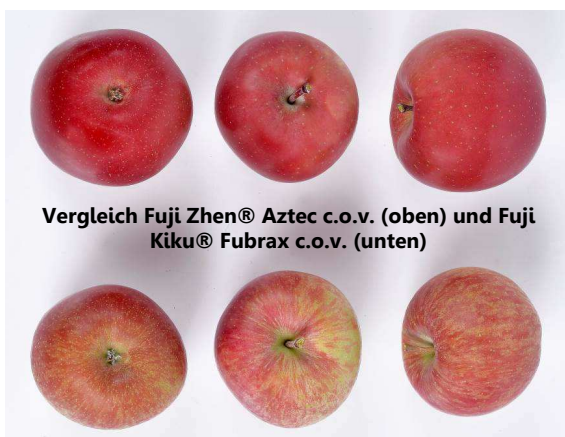
Vergleich Fuji Zhen® Aztec c.o.v. (oben) und Fuji Kiku® Fubrax c.o.v. (unten)

Die Ergebnisse und Fotos stammen aus den Versuchsanlagen von Dalival und IFO. Hinsichtlich der Ausbildung des Ertrags, der Fruchtgröße und der Deckfarbe auf verschiedenen Standorten, können wir keine Gewähr übernehmen.