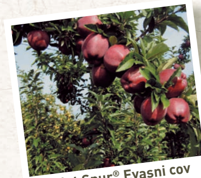
Scarlet Spur® Evasni cov