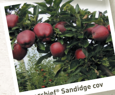
Superchief® Sandidge cov

Il rinnovo delle Delicious rosse nel mondo, la stabilità di queste varietà in Paesi emergenti e tradizionali come l'India, il Medio Oriente e certi Paesi europei, ci incita a presentare i cloni leaders del mercato, cloni di riferimento. Due grandi tipi di Delicious rosse coesistono oggi: i tipi spur (tipo II) ed i tipi standard (tipo III o semi spur).