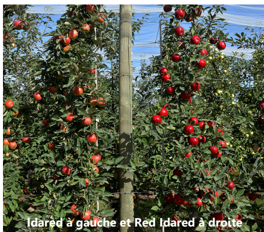
Idared à gauche et Red Idared à droite