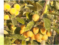
Malus Golden Hornet