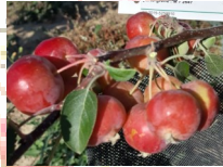
Malus Perpetu® Evereste

Los Malus no pueden ser injertados en campo ya que presentan sensibilidad a las enfermedades degenerativas.